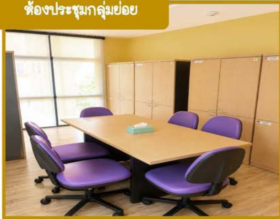
ห้องประชุมกลุ่มย่อย