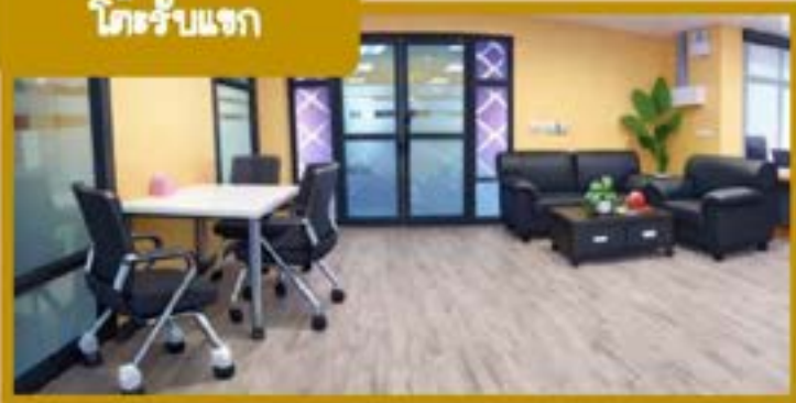
โต๊ะรับแขก